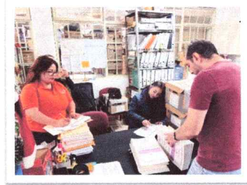
Transferencia Primaria de la Coordinación de Pueblos Indígenas