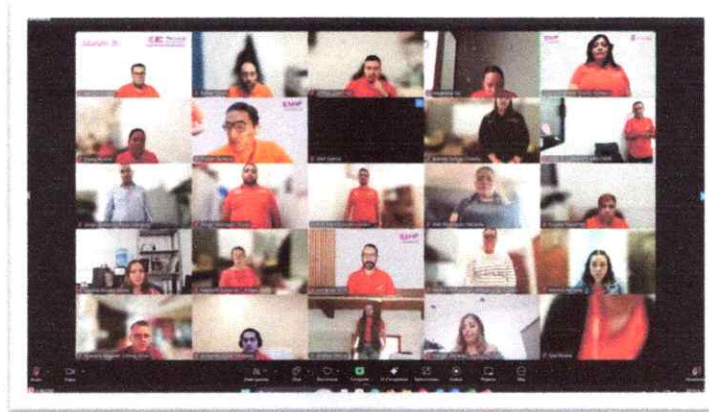
Sesión Ordinaria del SIA del 25 de septiembre de 2025