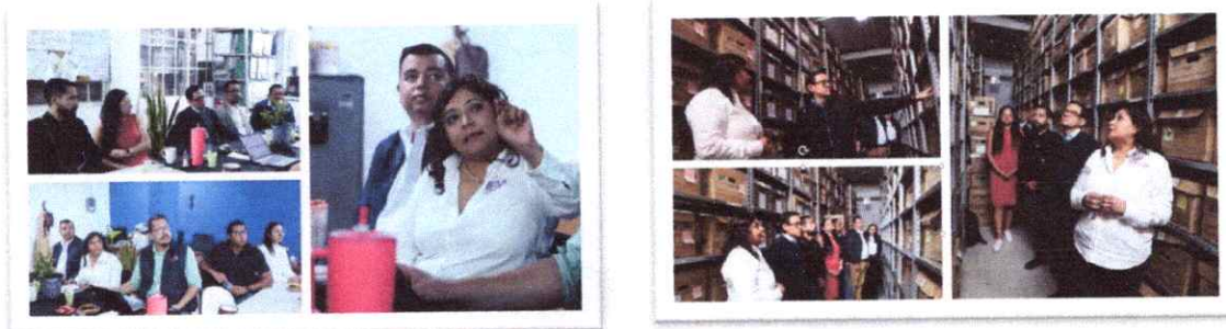
Capacitación Interinstitucional al Tribunal Electoral del Estado de Michoacán

favoreciendo una gestión documental más ordenada, eficiente y alineada con la normatividad vigente en la materia.