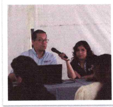
Capacitación Proceso de Oficialía de Partes 13 de octubre de 2025