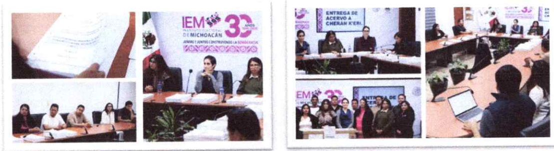
Transferencia Documental a la Comunidad de Chéran – kéri

Esta transferencia documental representa una acción relevante en materia de gestión archivística, transparencia y reconocimiento de los derechos de los pueblos y comunidades indígenas , al contribuir a la preservación de su memoria documental, facilitar el acceso a información histórica clave y fortalecer los vínculos de cooperación interinstitucional entre el Instituto Electoral de Michoacán y la comunidad de Cherán-K'eri.