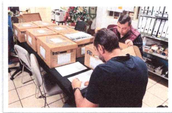
Transferencia Primaria de la Coordinación de Contencioso Electoral