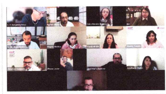
Sesión Extraordinaria del GI del 08 de diciembre de 2025