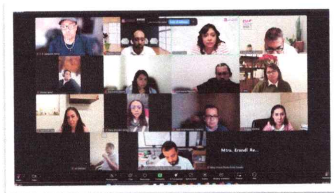
Sesión Ordinaria del GI del 30 de octubre de 2025

El 08 de diciembre de 2025 se realizó una sesión extraordinaria del GI, la cual tuvo el siguiente orden del día: