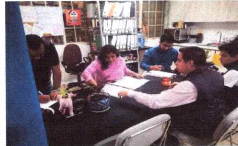
Inspección y Verificación de la Baja Documental de la Coordinación de Contencioso Electoral