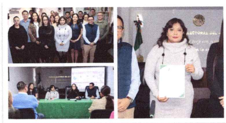
Asesoría Especializada en Tipología Documental al Tribunal Electoral del Estado de Michoacán

Esta capacitación contribuyó de manera significativa al fortalecimiento del compromiso interinstitucional , así como a la homologación de criterios archivísticos entre el Instituto Electoral de Michoacán y el Tribunal Electoral del Estado de Michoacán, impulsando el manejo adecuado, ordenado y transparente de la información documental , en beneficio de la eficiencia administrativa y la rendición de cuentas.