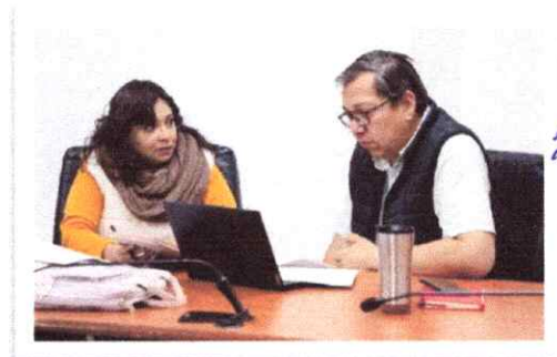
Capacitación de elaboración de flujogramas del 11 de noviembre de 2025