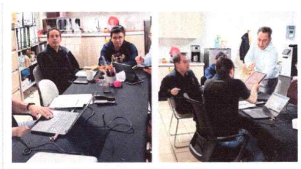
Capacitación especializada en flujogramas del 09 de diciembre de 2025