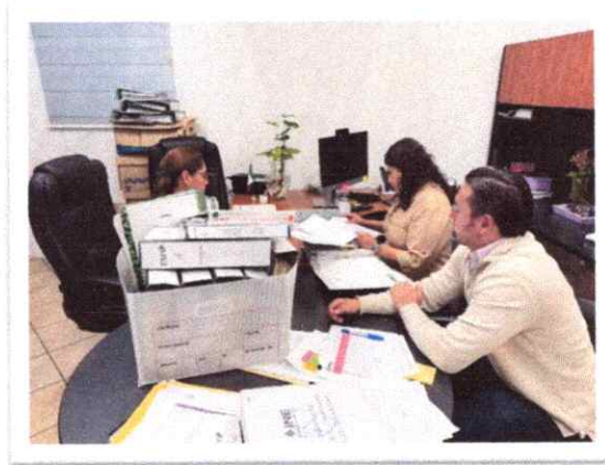
Capacitación de Valoración Documental a Secretaría Ejecutiva