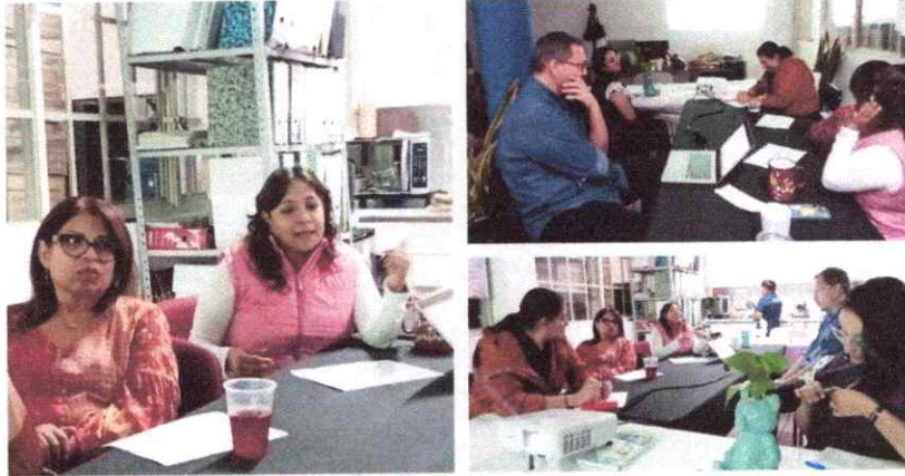
Capacitación de Manuales de Procedimientos del 17 de septiembre

congruencia con los objetivos establecidos en los informes cuatrimestrales en materia de archivos y gestión institucional.